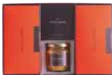
「デニッシュ×2 コンフィチュール×1 ティー×1」