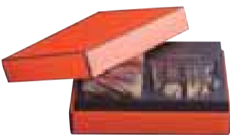
「デニッシュ×1 クルート×5」 スタンダードなマーブルデニッシュとマーブルクルートのセットです。