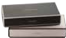
「クルートボックス」 オレンジボックスのほかにも、フレーバーによって異なるお色のボックスがあります。