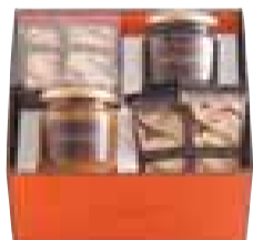
「クルートとコンフィチュールセット」(店舗限定販売) 先様に、午後のティータイムをゆったり過ごしていただきたい気持ちを込めて。