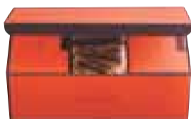
「デニッシュ×3」 デニッシュをたっぷり味わっていただける詰め合わせ。フレーバーを自由に。