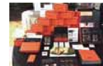
ブライダルフェアでのディスプレイ

挙式後、お客様から「引き菓子の次は、出産内祝いにも使いたい」というような声をお聞きするたび、マールデニッシュを通じて、大切な節目に立ち会う仕事をさせていただいていることを実感します。