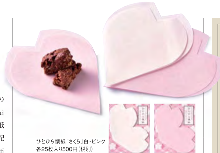
ひとひら懐紙「さくら」白・ピンク 各25枚入り500円(税別)

香ばしく焼いたマーブルデニッシュを3種類のチョコレートで甘さで包んだ、新しいおいしさ「マーブルクランチ 結々 Yui Yui」。舞妓さんをあしらったパッケージに、季節のチャーム(紙かざり)を添えてお届けしています。舞妓さんが、毎月の歳時記や花をデザインしたかんざしで装うように、パッケージから一年の彩りをお楽しみください。袋入りミニサイズ8個500円、箱入り8個1000円(税別) ●グランマーブル祇園で限定販売(→ショップデータはp2&p13。商品紹介p12もご覧ください)