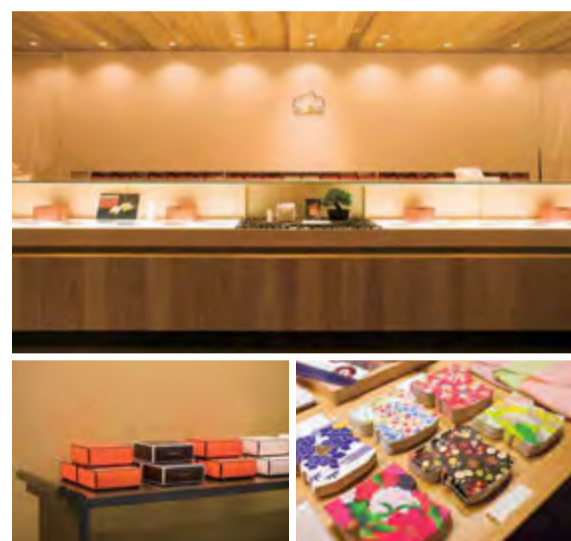
(左) マーブルクルートのボックスのシックさが引き立つ、凛とした和のディスプレイ。 (右) ちょっとしたメッセージを伝える一筆箋など、和の小物を集めたコーナー。

2014年の夏にオープンした、グランマーブル祇園。京都を代表する花街・祇園の目抜き通りである花見小路通に、松のシンボルマークを染め抜いた白・暖簾が目印です。和のしつらいの中で、マーブルデニッシュ、マーブルクルート、そして祇園ショップだけの限定アイテムをゆったりと選んでいただけます。一筆箋や懐紙など、お土産に最適な和の小物もご用意しています。