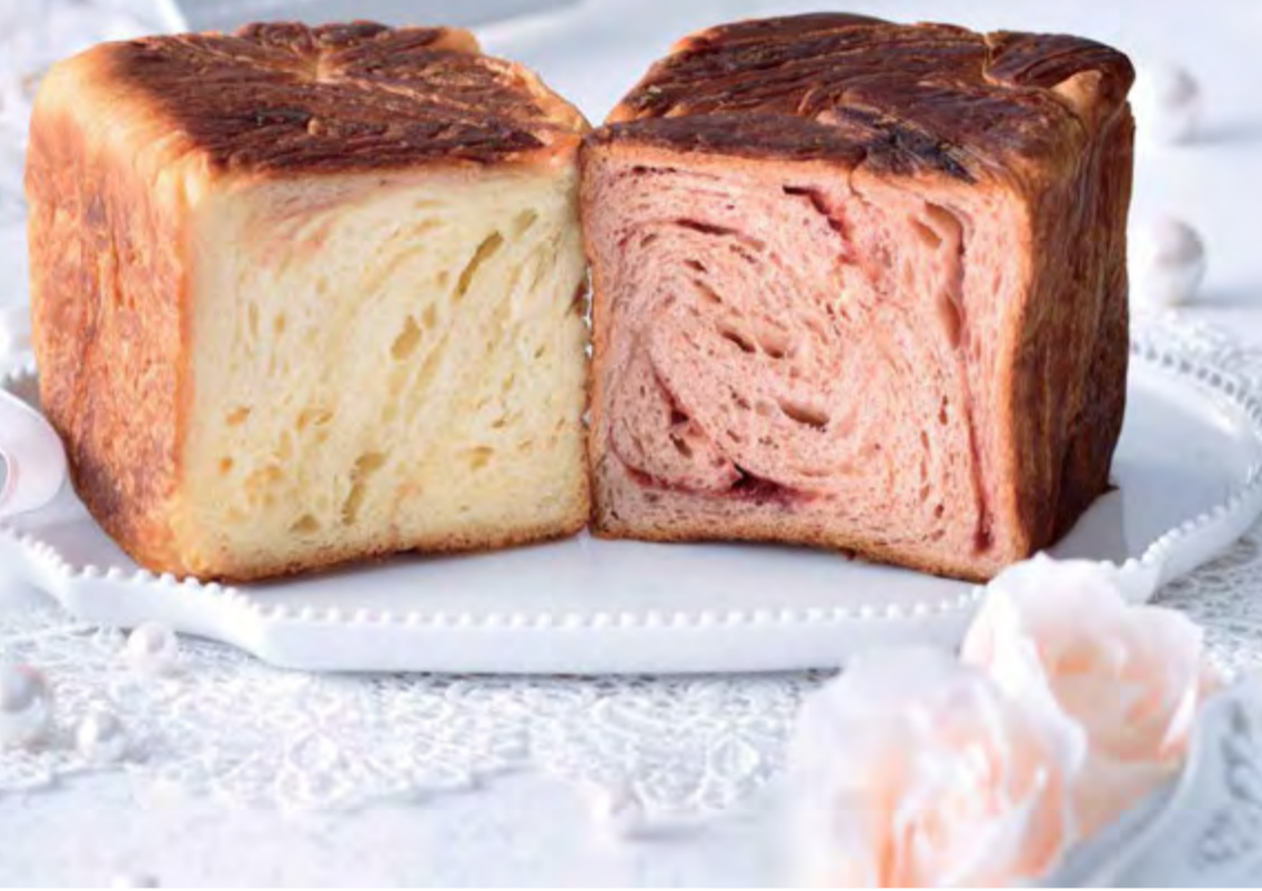
「Loveマーブル」はツートンカラーの特製ボックス入りです。

1本のデニッシュで2つの味が楽しめる、ダブルフェイスなデニッシュ「Deux MARBLE」シリーズに、新しい味わいが登場しました。イチゴミルクとホワイトチョコレート、永遠の定番ともいえるフレーバーを、赤×白のハッピーカラーに見立てた、その名も「Love マーブル」。寄り添うふたつのカラーと、甘く上品な味わいが、贈る人の晴れやかな気持ちをやさしく、深く伝えます。ご婚礼やご結婚記念日、お誕生日、ご入学、ご卒業などにご利用ください。1300円(税別)