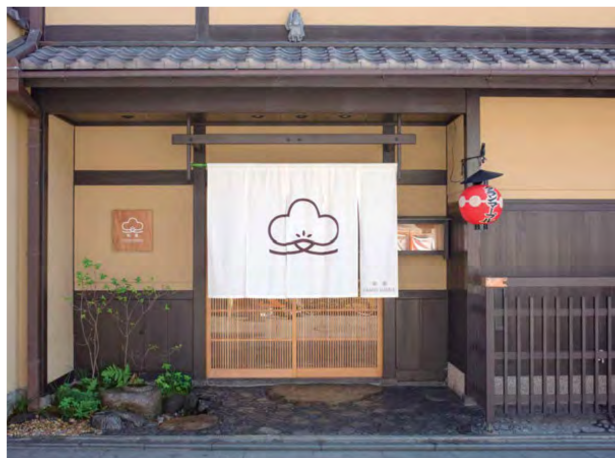
グランマーブル祇園 〒605-0074 京都市東山区祇園町南側570-238 京阪「祇園四条」駅6番出口から徒歩5分 Tel. 075-533-7600 Fax. 075-533-7601 11:00~20:00(季節により変動あり) 無休 (→MAP、データp13)