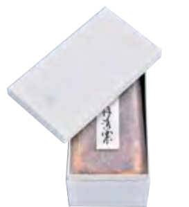
大切な人に贈る気持ちを確認に伝える、高級感あるパッケージ。