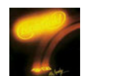
Mr. Lucky / Fool's Gold