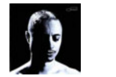
Jose James / No Beginning No End