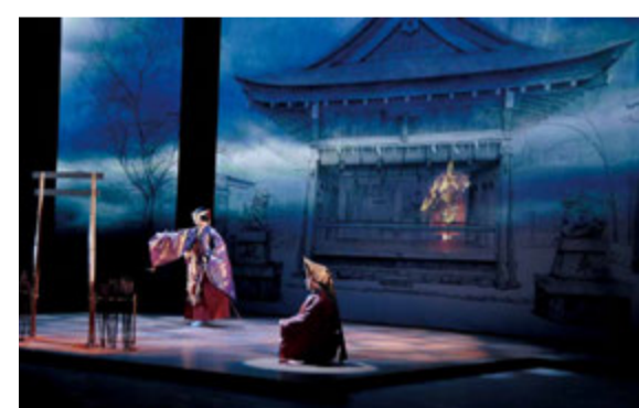
劇生劇場「Traditional Trial〜能、狂言ブラス〜」(札幌市教育文化会館)