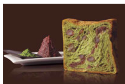
祇園辻利抹茶あん 1200円 祇園辻利の抹茶と、餡とかのこ入り、和の三重奏。