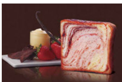
ショコラフレーズ 1400円 甘くまるやかな苺生地とプリンとチョコのトリオ。