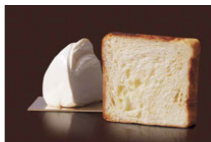
Dojiフロマージュ 1500円 クリームチーズのまろやかさは大人の風味。