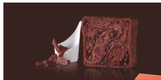
1~3月 フォンダンショコラ 1400円 ショコラ生地にチョコレートがたっぷり。温めると、とろり濃厚。パッケージは、特製ハートデザインのシール付き。バレンタインに。