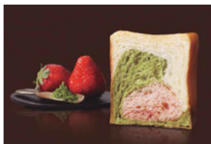
京都三色 1000円 祇園辻利の抹茶と苺、プレーンの京風トリコロール。