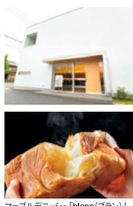
マーブルデニッシュ「blanc(ブラン)」

〒601-8182 京都市南区上鳥羽北島田町93 近鉄京都線「上鳥羽口」駅徒歩12分 Tel. 075-682-1200 Fax. 075-682-1201 10:00~19:00 無休 駐車場完備