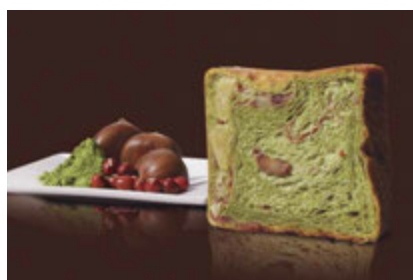
栗とあんこ祇園辻利抹茶スペシャル 1500円 かのこ豆、小倉あん、栗とお抹茶で、和の贅沢。