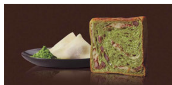
4~5月 祇園辻利抹茶とハッ橋 1100円 抹茶とハッ橋、京都名物コンビのマーブルデニッシュ。