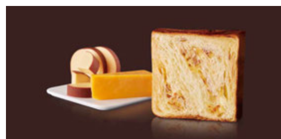
6月 スモークチーズ 1400円 スモークチーズとチェダーチーズが、芳醇なコクを醸す。