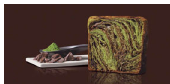
6月 祇園辻利抹茶ショコラ 1200円 抹茶とショコラの贅沢な競演は、ちょっと大人の味わい。