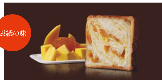
1~6月 オレンジマンゴー 1400円 しっとりしたマンゴーの果肉と、オレンジのはのかな酸味が夏気分。