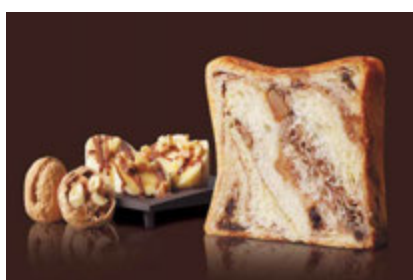
チョコバナナ&くるみプディング 1200円 バナナ風味の白あん、チョコにクルミのアクセント。