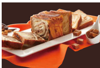
Deux MARBLEシリーズ ショコラ・ショコラ&メイプルキャラメル 1300円 1本でチョコとメイプルキャラメルの味を。