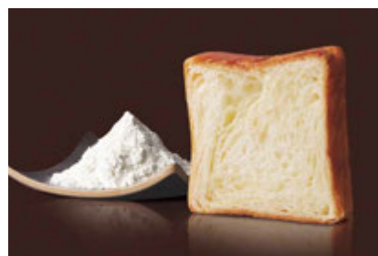
ブルーストーン 1000円 吟味された素材を味わうデニッシュのスタンダード。