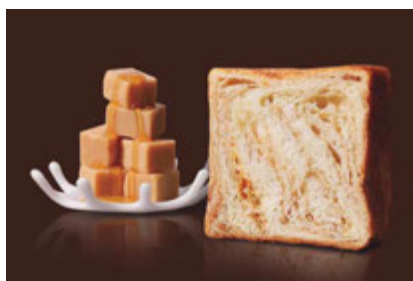
メイプルキャラメル 1000円 メイプルとキャラメルがとろりと甘くノスタルジック。