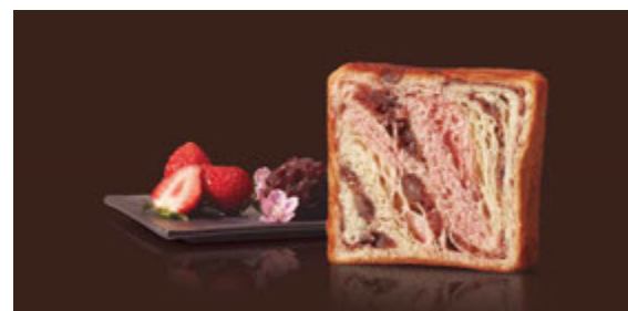
3~5月 さくら 1100円 桜色の苺生地が春気分いっぱい。あんことこの和の甘さ。