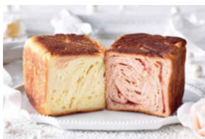
Deux MARBLEシリーズ LOVE MARBLE (ラブマール) 1300円 苺ミルクとホワイトチョコのマリアージュ。

マーブルデニッシュ、マーブルクルート、グランデニッシュには小麦、乳、卵を含みます。 表示価格は全て税別です。