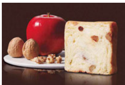
りんごくるみのプリンデニッシュ 1200円 プリン風味の生地、りんご、レーズン、クルミが仲良く。