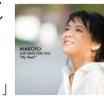
「JUST SING FOR YOU "My Heart"」

最新情報はwebサイト http://makototoko.com をチェック! また、webサイト 関西ウーマン「真筆のおおきにコラム」連載中。 https://www.kansai-woman.net