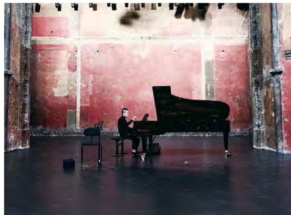
Théâtre des Bouffes du Nordでの演奏会の様子

Profile 1988年福岡市生まれ。桐朋女子高等学校音楽科(共学)ピアノ専攻を卒業。東京芸術大学作曲科入学後、パリに拠点を移す。フランス / パリ ビゾン市主催「Festival international de Barbizon」のオープニング作曲。ブダペスト / ステファニアバロタ城、パリ / ルーブル美術館、フランス文化・通信省、パリ / シャトレ座、パリ / Théâtre des Bouffes du Nord、ロンドン / Cadogan Hallなどで演奏。2016年9月にファーストアルバム「LIFT」を発表。