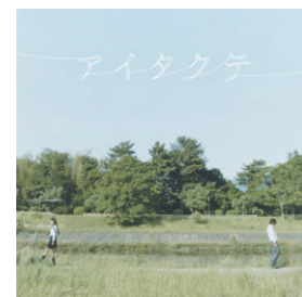
「アイタクテ」 (AICL-2030 1000円) 1000枚限定で自主制作され、SOLD OUTした伝説的シングルのメジャーデビュー盤。