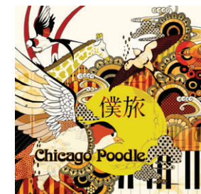
「僕旅」 (GZCA-5199 2500円) 09年11月にリリースされたシカゴプードルのメジャー初ファーストアルバム。