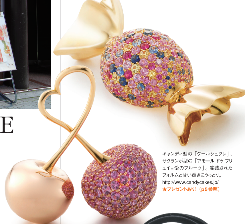
キャンディ型の「クールシュクレ」、サクランボ型の「アモール ドゥ フリュイ=愛のフルーツ」。完成されたフォルムと甘い輝きにうっとり。 http://www.candycakes.jp/ ★プレゼントあり! (p5参照)

子供の頃、キラキラしたキャンディやカラフルなフルーツが、まるで宝石のように輝いて見えた…。そんな思い出、ありませんか? キャンディケーキはそんな甘く優しい記憶を思い出させてくれる、夢心地なジュエリーブランド。たとえば、キャンディ型の「クールシュクレ」、サクランボ型の「アモール ドゥ フリュイ=愛のフルーツ」。ゴールドにブルーやピンクのサファイヤをちりばめ、甘さとゴージャスな輝きがキラリ。そんな遊び心あふれるスイーツなジュエリーは、大人の女性だけの特権です。