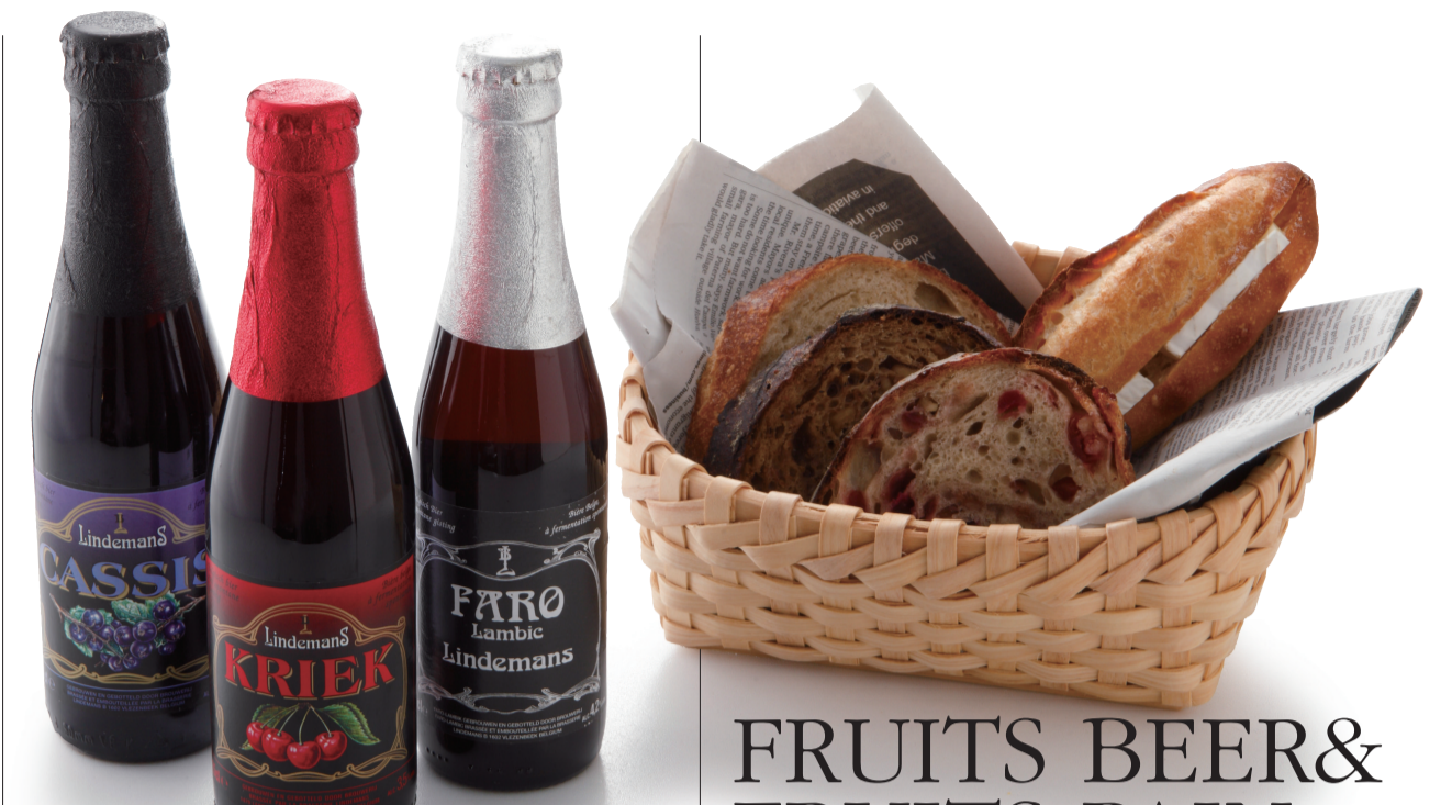
ベルギービール(左から)カシス、クレーク(サクランボ)、ファロ 各735円。パン(左から)プレーンの全粒粉パン、イチジクのワイン煮、クランベリー3枚入り「アラカルト」450円、カンパベル290円。

たとえば写真の詰め合わせの一例は、マーブルデニッシュ・京都三色1050円、ハニー・春の花々900円、コンフィチュール・ゴールドデニッシュ1200円(入荷は9月から)、合計3150円。