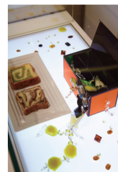
スイーツの名店が並ぶ周防町で、ひととき目を引くファサード。ディスプレイも宝石をイメージ。