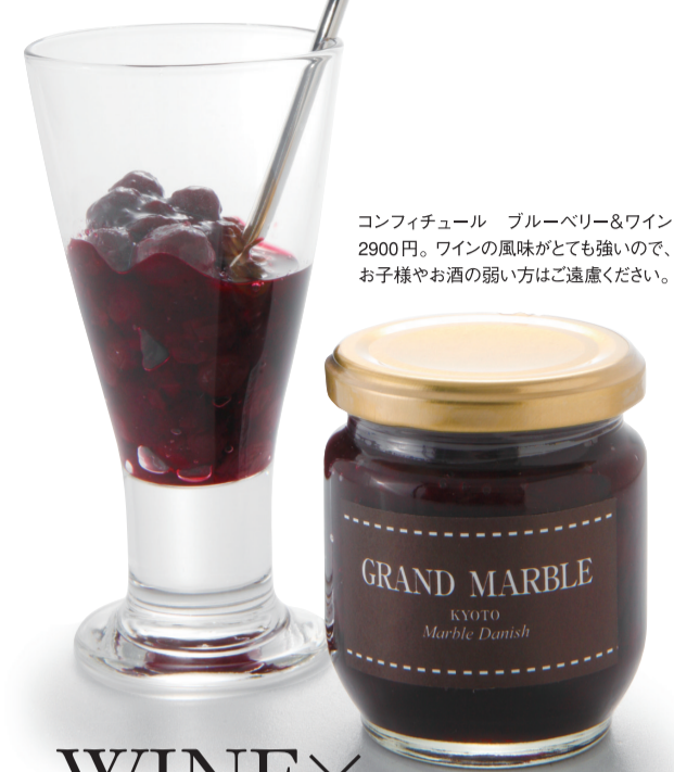
コンフィチュール ブルーベリー&ワイン 2900円。ワインの風味がとても強いので、お子様やお酒の強い方はご注意ください。