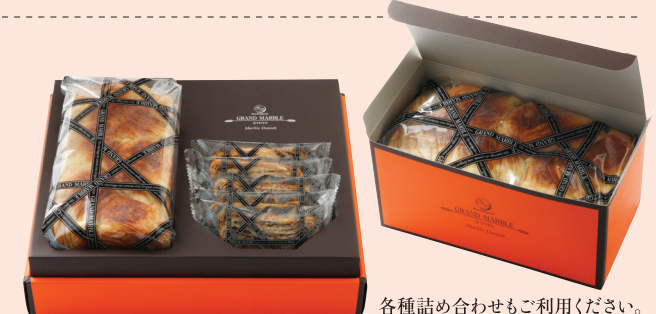
各種詰め合わせもご利用ください。