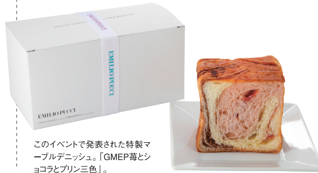
このイベントで発表された特製マーブルデニッシュ。「GMEP篇とシヨコロとプリン三色」。

アーティストックでグラマラスな色彩づかいで世界のセレブに愛されるイタリアのブランド、エミリオ・プッチがNTTdocomoの新機種とコラボレーション。6月3日に東京・恵比寿ガーデンプレイス THE GARDEN HALLで、ローンチイベント（発表会）が開催されました。会場ではエミリオ・プッチのファッションショーが開催され、イベントに協賛したグランマールはエミリオ・プッチバージョンのデニッシュを発表。セレブやメディア関係者、高感度なファッションビブラーに大好評を得ました。