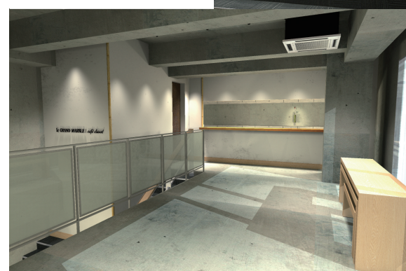
コンクリート打ちっばなしのクールでモダンなデザインに、和のしつらえをプラス。パーティーや展示など幅広い使い方ができるギャラリー空間。

京都でも最もにぎわうストリート、三条通のランドマーク的存在、ル・グランマール カフェ クラッセ。その2階に、新しいスペースがオープンしました。ギャラリーと畳の間に配した京都ならではの空間のコンプレックス。このスペースは、さまざまなフィールドで活躍するクリエイターを応援するグランマールが、展示会やイベントを通して新しい表現を発信する場にもなります。グランマールが生まれた地、京都の伝統と未来を感じてください。（→ショップデータはp7）