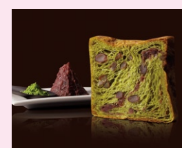
祇園辻利抹茶あん

プレーン生地にチョコレド、甘くなめらかなプリン、香ばしいくるみとバナナあんが織りこまれたりッチなデニッシュ。