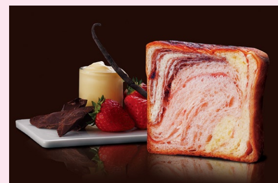
【表紙の味】 ショコラフレーズ

新しいおいしさのイースト菓子、マールデニッシュ。人気の定番のほか、季節限定のマールデニッシュも随時登場します。グランマールが誇る、さまざまなフレーバーを、ぜひお楽しみください。