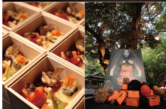
上賀茂神社で開催されたイベント、「にっぽんと遊ぼう」。左下は、参加者にふるまわれたマールデニッシュを使った創作料理。