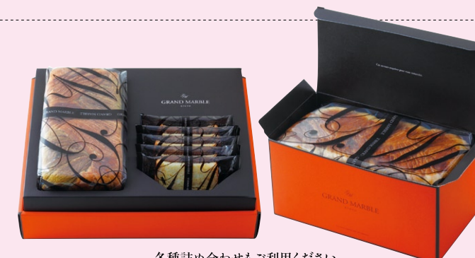
各種詰め合わせもご利用ください。