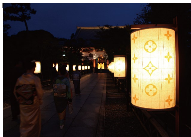
工芸家とアーティストによるコラボレーション作品も登場しました。

中田英寿が代表理事を務めるTAKE ACTION FOUNDATIONによる、「TAKE ACTION CHARITY GALA 2010 with LOUIS VUITTON」が、さる10月、開催されました。チャリティー・ガラとは、社会貢献を目的にしたパーティー。この夜はルイ・ヴィトンの限定アイテムほか、奈良美智、町田康などアーティストによるコラボレーション作品がオークションに登場。収益は、日本の伝統工芸の発展のために役立たせられます。裏千家のお茶席や京舞も披露され、ラグジュアリーな中にも日本文化への思いが伝わるイベントでした。