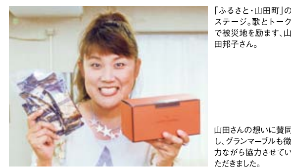
「ふるさと・山田町」のステージ。歌とトークで被災地を励ます、山田邦子さん。