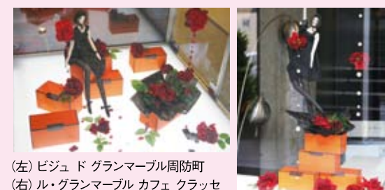
(左) ビジュ ド グランマール 周防町 (右) ル・グランマール カフェ クラッセ

ショップの前を通るたびに、シーズンごとのときめきを感じていただきたい...「ル・グランマール カフェ クラッセ」と、「ビジュ ド グランマール 周防町」では、春夏秋冬、そしてクリスマスやバレンタインなど、年6回、さまざまなディスプレイを展開しています。是非ご覧ください。