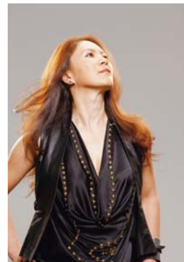
Profile 92年「STOP MOTION」で歌手デビュー。ヒット曲多数。08年から精力的にツアーを行い、2011年にはNHKドキュメンタリー番組のナレーションにも挑戦。マルチな活動を展開するアーティスト。