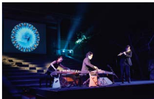
総本山・仁和寺を舞台にした音楽と映像のコラボレーション。

日本文化の新しい価値の掘り起こしをテーマにした「にっぽんと遊ぼう」。2011年10月4・5日に「仁(ひと)を結び和の宝」と題して京都の世界遺産・仁和寺で開催されました。第18回を数えるこのイベントに、今年もグランマールは参加いたしました。京都の名刹を舞台に、チャリティーオークション、アーティストによるライブパフォーマンスが秋の夜を彩りました。