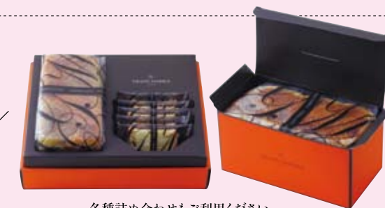
各種詰め合わせもご利用ください。