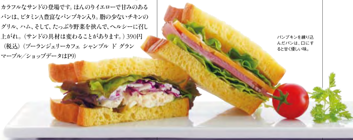
パンプキンを練り込んだパンは、口にするとうまく優しい味。

「ブーランジェリーカフェ シャンブル ド グランマール」に、カラフルなサンドの登場です。ほんのりイエローで甘みのあるパンは、ビタミンA豊富なパンプキン入り。脂の少ないチキンのグリル、ハム、そして、たっぷり野菜を挟んで、ヘルシーに召し上がれ。(サンドの具材は変わることがあります。) 390円(税込) (ブーランジェリーカフェ シャンブル ド グランマール/ショップデータはP9)