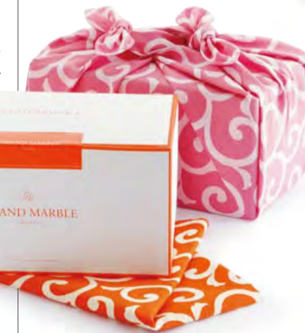
ピンクやオレンジ...ポップな唐草模様の風呂敷は「唐草屋」さんの人気アイテム。

贈る心を包む、和のラッピング文化・風呂敷。「ル・グランマール カフェ クラッセ」店頭で数種類の風呂敷からお好みの色をチョイスし、デニッシュをお包みするサービスが始まります。京都の老舗風呂敷メーカーがプロデュースする風呂敷ブティック「唐草屋」(P5)さんのコラボレーションで、春の限定サービスです。詳しくは店頭でお問い合わせください。(ル・グランマール カフェ クラッセ/ショップデータはP9)