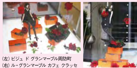
(左) ビジュ・ド・グランマール周防町 (右) ル・グランマール カフェ クラッセ

ショップの前を通るたびに、シーズンごとのときめきを感じていただきたい…。「ル・グランマール カフェ クラッセ」と、「ビジュ・ド・グランマール 周防町」では、春夏秋冬、そしてクリスマスやバレンタインなど、年6回、さまざまなディスプレイを展開しています。是非ご覧ください。