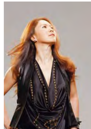
Profile 92年「STOP MOTION」で歌手デビュー。ヒット曲多数。08年から精力的にツアーを行い、2011年にはNHKドキュメンタリー番組のナレーションにも挑戦。マルチな活動を展開するアーティスト。