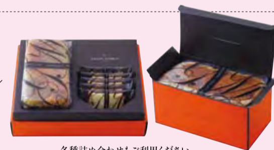
各種詰め合わせもご利用ください。