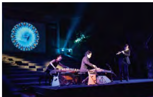
総本山・仁和寺を舞台にした音楽と映像のコラボレーション。

日本文化の新しい価値の掘り起こしをテーマにした「にっぽんと遊ぼう」。2011年10月4・5日に「仁（ひと）を結びし和の宝」と題して京都の世界遺産・仁和寺で開催されました。第18回を数えるこのイベントに、今年もグランマールは参加いたしました。京都の名刹を舞台に、チャリティーオークション、アーティストによるライブパフォーマンスが秋の夜を彩りました。