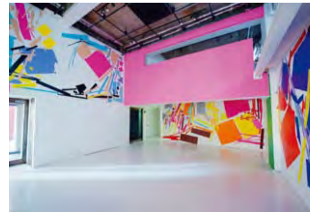
2011年 Calm & Punk galleryでの「幾々」の展示風景。カッティングシートにより空間に鮮やかな色彩が散りばめられている。