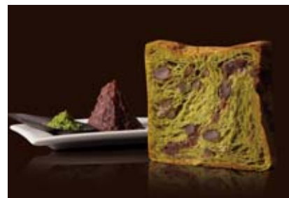
祇園辻利抹茶あん 1200円 祇園辻利のお抹茶と、餡とかのこ。和の贅沢極まる。