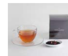
フレーバーティーセット ダーズリン、ピンクローズ、ミルクシユクレメの3つの味をセット。ティーバッグ各4袋入り 1500円