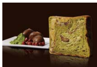
栗とあんこ祇園辻利抹茶スペシャル 1500円 お抹茶の香りの生地にかのこ豆、小倉あん、栗入り。