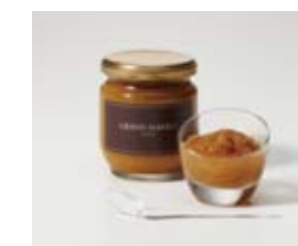
ゴールデンビーチ 1200円