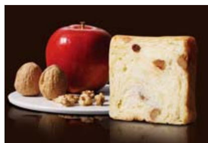
りんごとくるみのプリンデニッシュ 1200円 りんごとレーズン、クルミをプリン風味の生地で包んで。