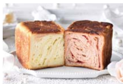
Deux MARBLEシリーズ LOVE MARBLE (ラブマーブル) 1300円 苺ミルクとホワイトチョコ。1本にふたつの味。