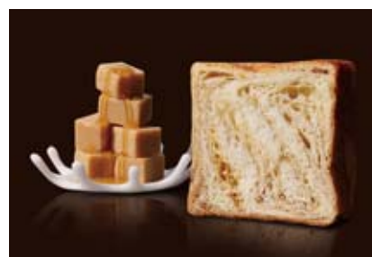
メイプルキャラメル 1000円 とろりと甘く、ノスタルジックなメイプルとキャラメル。