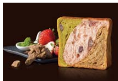
9~10月 京の秋味 1100円 苺のピンク、抹茶の緑、黒糖の茶色にかのこを添えて。