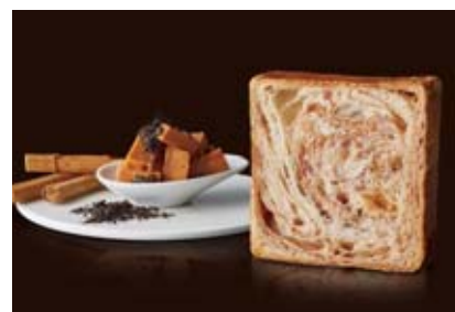
10月~12月 新商品 シナモンキャラメル 1300円 シナモンの甘い香りがキャラメルと好相性。