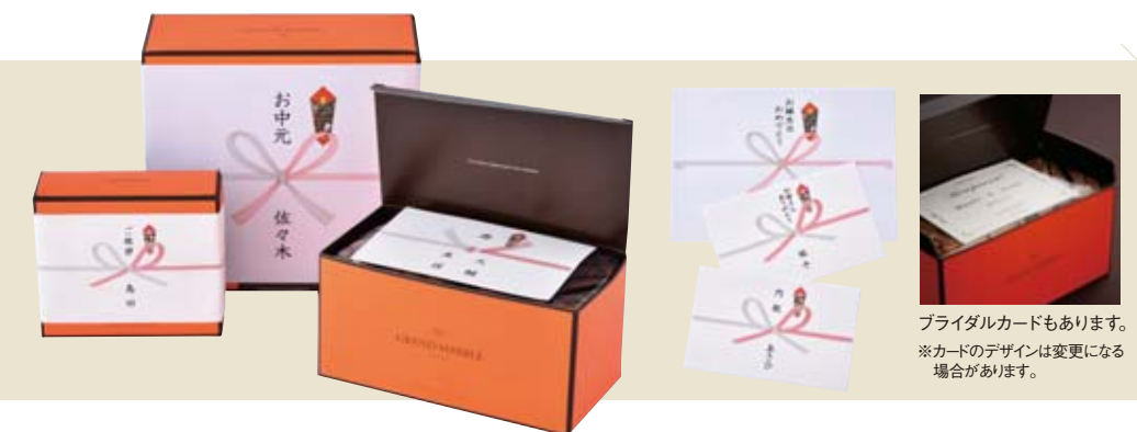
フライダカードもあります。※カードのデザインは変更になる場合があります。

大切な人へ、お祝いや感謝を込めてお届けする贈り物。その気持ちを伝えるメッセージである「のし」は、日本の贈る文化のシンボル。グランマーブルでは、あらゆる「贈る」場面でご活用いただける「のし」[のしカード]をご用意して、贈る方の気持ちを伝えるお手伝いをしています。店頭でも、オンラインショップでも受け付けております。どうぞ、ご遠慮なくお申し付けください。