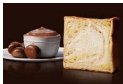
11月~12月 和栗のモンブランデニッシュ 1600円 ココと味わいが自慢の和栗。秋冬限定の味。