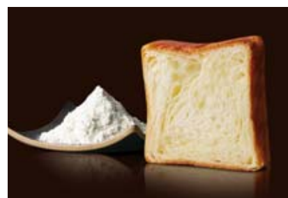
プレステージ 1000円 吟味した素材をシンプルに焼き上げたスタンダード。

◎人気の定番 通年販売している人気フレーバーです。 ※2015年7月より一部商品の価格を改訂しております。