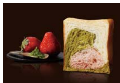
京都三色 1000円 祇園辻利のお抹茶と甘酸っぱい苺、プレーン。