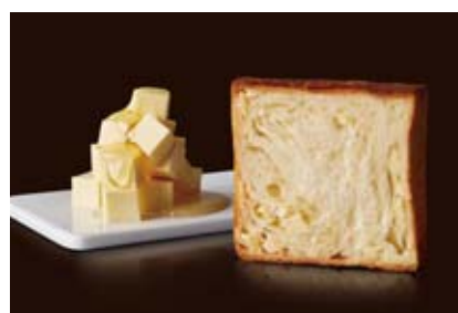
7~8月 新商品 ハニーフロマーシュ 1400円 チーズのまろやかさをハニーの甘さが引き立てる。