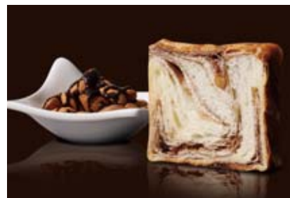
ショコラ・ショコラ 1200円 クラッシュアーモンドの香ばしさとビターなチョコ。