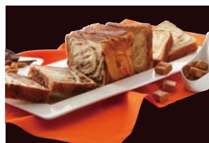
Deux MARBLEシリーズ ショコラ・ショコラ&メイプルキャラメル 1300円 1本で、人気のふたつの味が楽しめます。