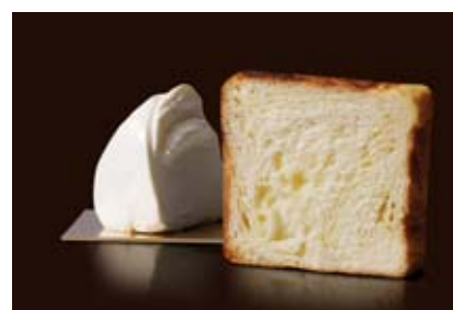
Dojiフロマーシュ 1500円 たっぷり織り込んだフランス製クリームチーズ。