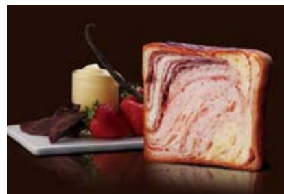
ショコラフレーズ 1400円 苺生地とプリンとチョコ。人気の甘さがトリオで。