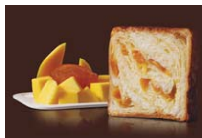
7月 オレンジマンゴー 1300円 トロピカルな香りとオレンジ色の果肉がフレッシュ!