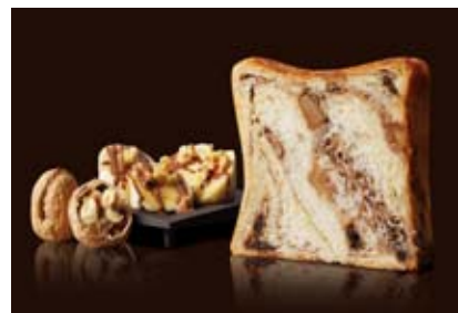
チョコバナナ&くるみプディング 1200円 バナナ風味の白あん、チョコとクルミが印象的。