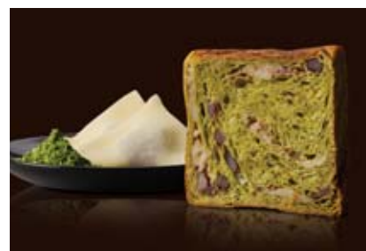
8~9月 祇園辻利抹茶とハッ橋 1100円 京都らしい祇園辻利のお抹茶と生ハッ橋のコンビ。