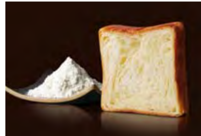
プレステージ 1000円 デニッシュのスタンダード。吟味された素材の味わい。