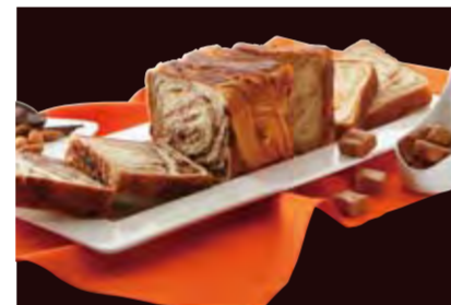
Deux MARBLEシリーズ ショコラ・ショコラ&メイプルキャラメル 1300円 1本で、人気のふたつの味が楽しめる Deux MARBLE。