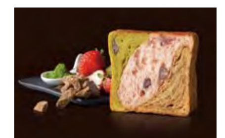
9~11月 京の秋味 1100円 イチゴと抹茶、黒糖の三色で秋色をイメージしたデニッシュ。