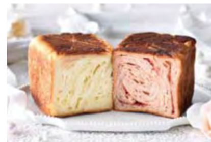
Deux MARBLEシリーズ LOVE MARBLE(ラブマーブル) 1300円 1本に、苺ミルクとホワイトチョコの味がとけ合う。

マーブルデニッシュ、マーブルクルート、グランデニッシュには小麦、乳、卵を含みます。表示価格は全て税別です。