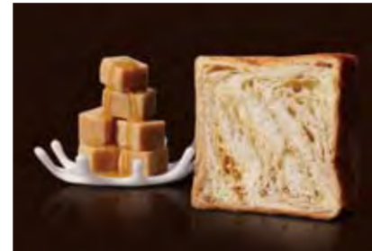
メイプルキャラメル 1000円 懐かしいキャラメルの甘さ、メイプルのまろやかさ。