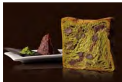
祇園辻利抹茶あん 1200円 和の贅沢風味。祇園辻利のお抹茶と餡とかのこ入り。