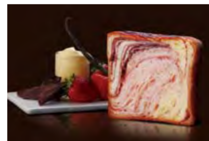
ショコラフレーズ 1400円 苺生地とプリンとチョコ。ア・ラ・モードな一本。