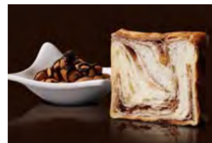
ショコラ・ショコラ 1200円 クラッシュアーモンドの香ばしさと、少しビターなチョコ。