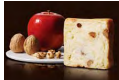
りんごくるみのプリンデニッシュ 1200円 りんごとレーズン、クルミが入ったプリン味のデニッシュ。