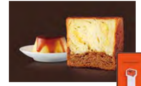
7~12月 <グランマーブル20周年記念 復刻>プリン 1300円 人気のレシピが復刻。特製オレンジBOXふせん付。