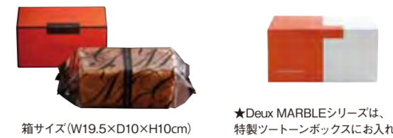
箱サイズ(W19.5×D10×H10cm) *Deux MARBLEシリーズは、特製ツートンボックスに入れます。

マーブルデニッシュ、マーブルクルート、グランデニッシュには小麦、乳、卵を含みます。表示価格は全て税別です。