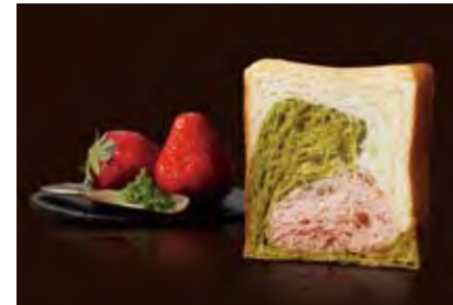
京都三色 1000円 祇園辻利の抹茶と苺、プレーンの三色で京都をイメージ。