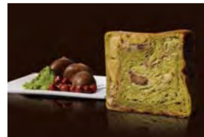
栗とあんこ祇園辻利抹茶スペシャル 1500円 かのこ豆、小倉あん、栗とお抹茶で、和の豪華さ。