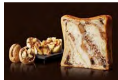
チョコバナナ&くるみプディング 1200円 バナナ風味の白あん、チョコとクルミの出会い。