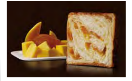
7~8月 オレンジマンゴー 1400円 マンゴーとオレンジ。甘酸っぱい爽やかさで夏らしさ一番。