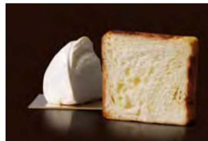
Dojiフロマージュ 1500円 フランス製のクリームチーズを練り込んだ大人の味。