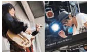
(左) 大阪城音楽堂にロックサウンドを響かせたHeavenstamp。(右) クラフツァー・エレクトロ口まで、ボーダレスな魅力を放つ録音家Schroeder-Headz。