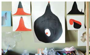
見ているとイメージが広がるかわらけローリング。