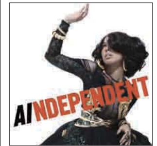
「INDEPENDENT」 TOCT-28043 3000円(税込)

L.A.生まれ、2000年のメジャーデビュー以来、圧倒的な歌唱力でソウル、ヒップホップ、ダンスとボーダレスに表現する日本人女性シンガーAI。アルバム「INDEPENDENT」にはマイケル・ジャクソンのトリビュートライブのテーマソングも収録。ジャクソン・ブラザーズが第1マイケルに捧げた曲を AIとともに歌い上げた、音楽史に残る1曲。デジタル限定のリリース「ハビネス -Reggae Summer Remix by Mighty Crown」もダウンロード開始。