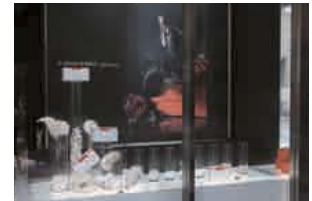
ル・グランマール カフェ クラッセ

「ル・グランマール カフェ クラッセ」と、「ビジュ ド グランマール 周防町」では、お客様にシーズンやイベントを楽しんでいただけるディスプレイを展開しています。爽やかなウインドーディスプレイを、ぜひご覧ください。