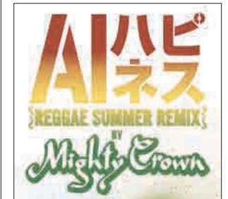
「ハビネス-Reggae Summer Remix by Mighty Crown」 ダウンロードはこちら http://recochoku.com/club/ai/