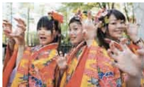
「マゼミ(にぎやかな女の子)」を意味する、沖縄の元氣娘(サンサナー)。