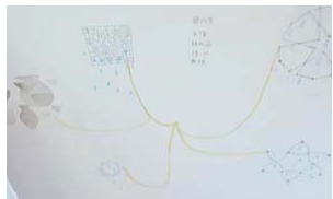
壁にあったのは作品構想のアイデアスケッチ。